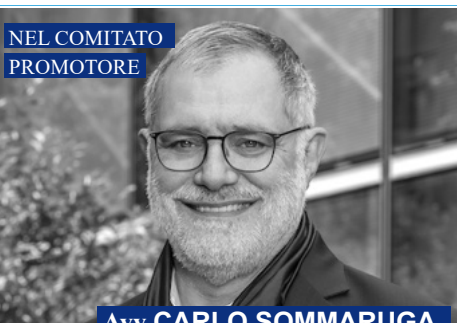
Avv CARLO SOMMARUGA

BOZZA Politico svizzero del Partito Socialista. Avvocato di formazione, è stato membro del Consiglio Nazionale dal 2003 al 2019 e dal 2019 fa parte del Consiglio degli Stati per il Canton Ginevra. Si è distinto per il suo impegno su Diritti Umani, giustizia sociale, affari e politica estera. È anche attivo come presidente dell'Associazione Svizzera Inquilini. Unisce esperienza politica e sensibilità per temi umanitari.